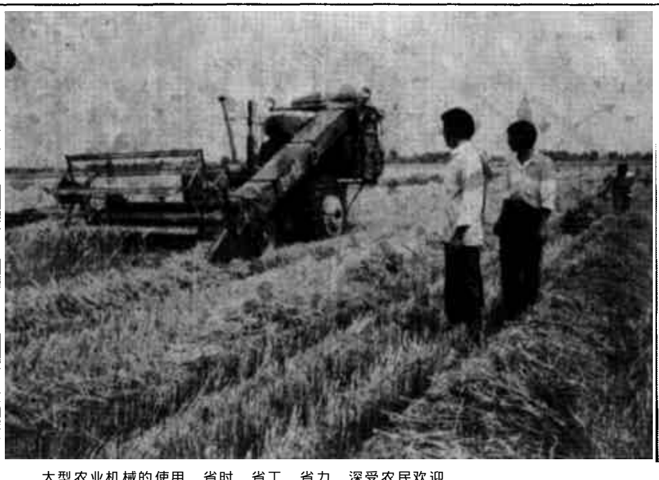
大型农业机械的使用，省时、省工、省力，深受农民欢迎。

该公司对理赔措施的加强与完善，保证了赔案质量，加快了理赔速度，改变了保户对保险公司的看法，树立了保险公司为民服务的良好社会形象，受到了社会各界的普遍好评。